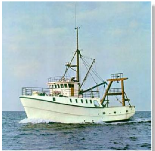
Figur 4: 50 m langt fiskefartøy i sandwich fra Greben i Kroatia

Det er hevdet i litteraturen [2] at det også lages fiskefartøy i denne størrelsen i komposittmaterialer i Japan og at 60 % av den japanske fiskeflåten består av komposittfartøyer.