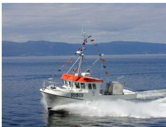
Figur 2: Kystfiskefartøy på 35 fot i komposittmateriale fra Norpower (til venstre). Norpower arbeider nå med et tilsvarende fartøy på 38 fot. Bildet til høyre viser en Proff Speedsjark på 38 fot i kompositt fra Selfa Arctic. Dette fartøyet har en toppfart på 24 knop.

Disse fartøyene (opp til ca. 40 fot) bygges i form som enkeltskallkonstruksjoner. Et formsett til slike båter består av former til skrog, innredning, dekk, overbygning, casing og topphatt (tak på styrehus). Produksjonsprosessen er i dag i hovedsak basert på håndopplegg.