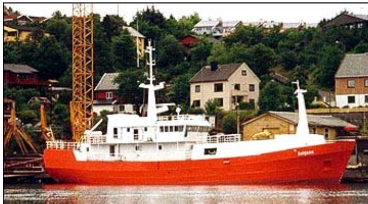
Figur 5: Sandwichoverbygg til fiskebåten MS Solgunn

Figur 5 viser et sandwichoverbygg på fiskebåten M/S Solgunn (60 meter langt stålfartøy). I dette tilfellet ga bruk av sandwich en vektbesparelse på rundt 50 %. Overbygget er på to etasjer, 10-12 meter langt og 5 meter bredt. Det ble installert i forbindelse med en ombygging av båten. Silverplast AS utførte arbeidet med overbygget.