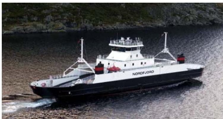
Figur 6: Sandwichoverbygg til kystfergen MS Nordfjord

Figur 6 viser fergen MS Nordfjord med et overbygg i sandwich. Overbygget ble laget av Norwegian Marine AS i Eikefjord. Skroget er 72 meter langt og laget i stål. Eieren er rederiet Fylkesbåtane i Sogn og Fjordane (FSF). I følge rederiet ble overbygget i sandwich hele 30 tonn lettere enn andre alternativer, ned fra 45 til 15 tonn. Fordi kjernematerialet som benyttes i sandwich har meget gode isolerende egenskaper, slapp man også å etterisolere innredningen.