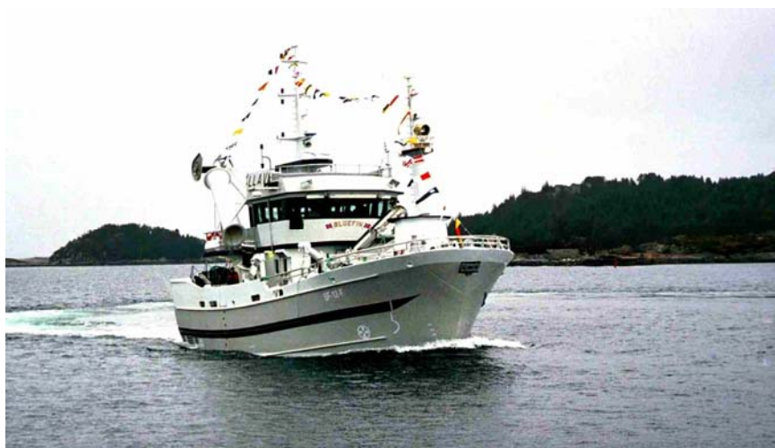
Figur 3: Bluefin, 70 fots fiskefartøy i sandwich bygget hos Mundal Båt AS

De største fiskefartøyene vi har funnet som lages i komposittmaterialer er opp til ca. 50 meters lengde (ca. 165 fot). Bildet i figur 4 viser et 50m langt fiskefartøy i sandwich fra Greben i Kroatia.